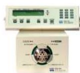
オートインジェクター EAS-20S