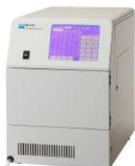
オートサンプラー M-510