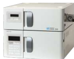
酸化窒素分析システム ENO-30