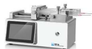
マイクロシリンジポンプ ESP-36