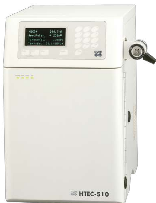
微量生体試料分析システム HTEC-510