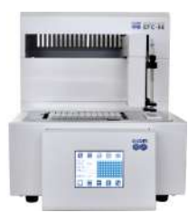
フラクションコレクター EFC-96