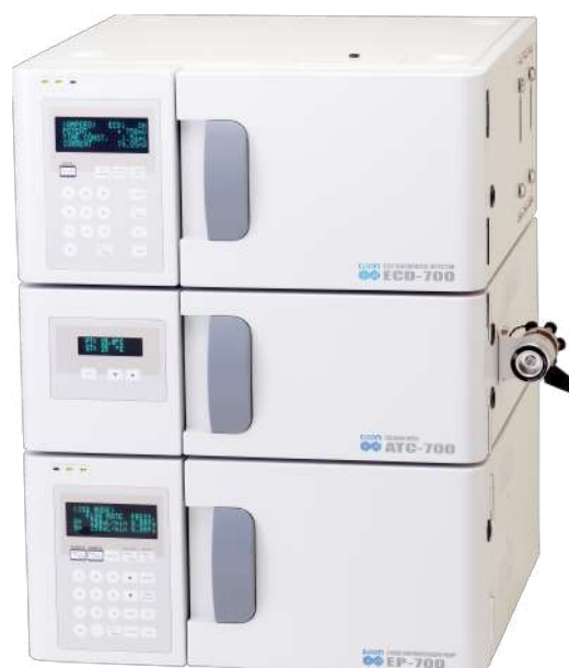
電気化学検出器/カラム恒温槽/ポンプ ECD-700/ATC-700/EP-700